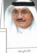
رئيس على مبارك

يقض العطاء السخي والمسامحة الوطنية لشراء الخبز، بدأت جمعية البحرين الخيرية في توزيع 6000 وجبة إفطارية متميزة ضمن مشروع إفطار صائم، وتغر وتل على سائر الامين لكي بالجمعيات ان الجمعية - كماكانها السنوية - اعطت مشروع الإفطار على وجه اطلاق العام 2024-2024، اله بإطلاق وجبة افطار صائم كعادتها السنوية منذ تاسيس الجمعية، وذلك انطلاقا من قول رسول الله صلى الله عليه وسلم: من فعل صالحا كان له مثل اجره غير انه لا ينقص من اجر الصالح شيئا، وتبادر عمير الخوجة لأمير الصائمين والمبرعين في العراق والشرق على هذا المشروع الريفي الخيري البارز، وكل عام والجمع خير وصحة وعافية.